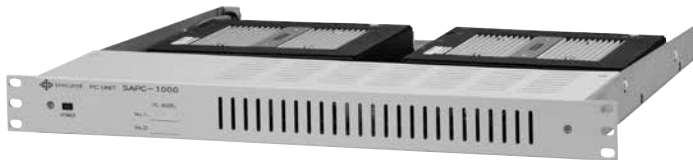
告知放送PCユニット