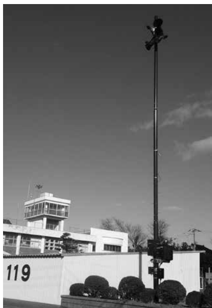
屋外拡声子局施工事例