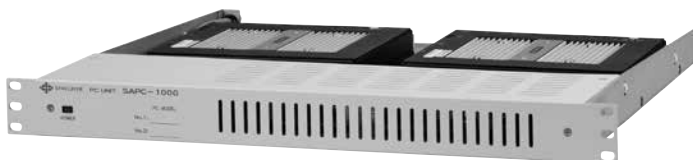
告知放送PCユニット