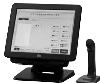
IP遠隔放送装置クライアントPC